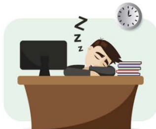
الإهمال في العمل