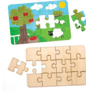
تركيب لوحة بزل